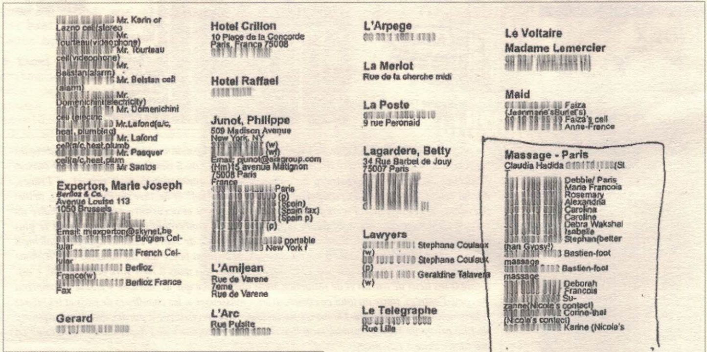
Quelques unes des adresses parisiennes de Jeffrey Epstein